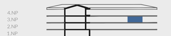
p o h l e d n a f a s á d u - s c h é m a / f a c a d e v i e w - s c h e m e