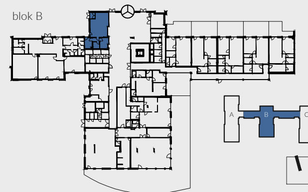
schéma půdorysu 1. NP / scheme of the first floor

Upozornění: Plochy jednotlivých místností jsou pouze orientační. Vyobrazené vybavení a vnitřní dělicí konstrukce znázorněné na produktovém listu (nábytek, kuch. linka, el. spotřebiče atd.) nejsou součástí dodávky. Komerční jednotky jsou vyhotoveny v provedení: obvodových svislých konstrukcí vč. výplní otvorů, připojovacích bodů provzduchotechniku, ústřední topení, zdravotnicku a silnoproud (potrubí, resp. rozvody budou ukončeny do 1m od obvodové svislé konstrukce komerční jednotky nebo v instalační šachtě), EPS hlásiče, rozvodů požární vody a vybavení PHP. Investor si vyhrazuje právo na drobné úpravy.