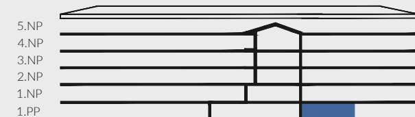
pohled na fasádu - schéma / facade view - scheme