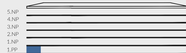
p o h l e d n a f a s á d u - s c h é m a / f a c a d e v i e w - s c h e m e